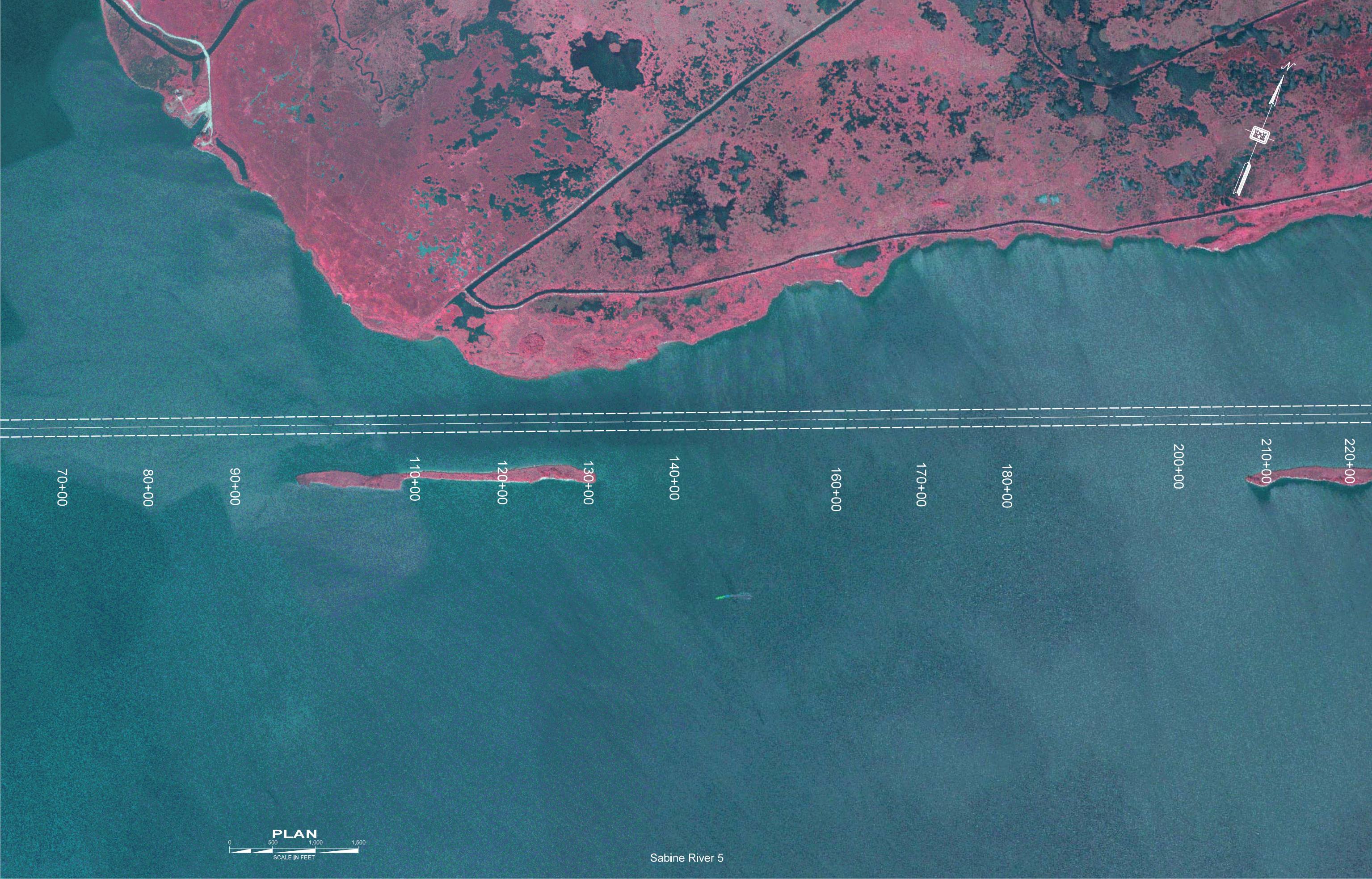
Sabine River 5